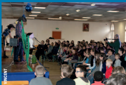
12 dicembre: Albero di Natale dei bambini del personale dei Santuari.